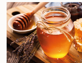
Verschiedene Honigsorten Raps, Blüte, Wald, Obstblüte

Z.b: Honig, Blütenpollen, Propolis, Gelee Royal, Salben, Bienenwachs, uvm. auf Anfrage