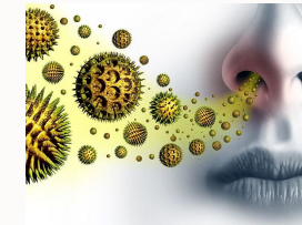
Heuschnupfen in 6-9 Sitzungen verschwunden

Die Bienenstock-Luft hilft bei vielen anderen Dinge wie Z.b: Heuschnupfen, Depressionen, Migräne, Schlaflosigkeit, Nasennebenhöhlenentzündung uvm