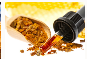
Bienenkitharz (Propolis) Granulat, Pulver, Tinktur