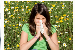
Ewiges Niesen und Schnupfen ein Ende setzen